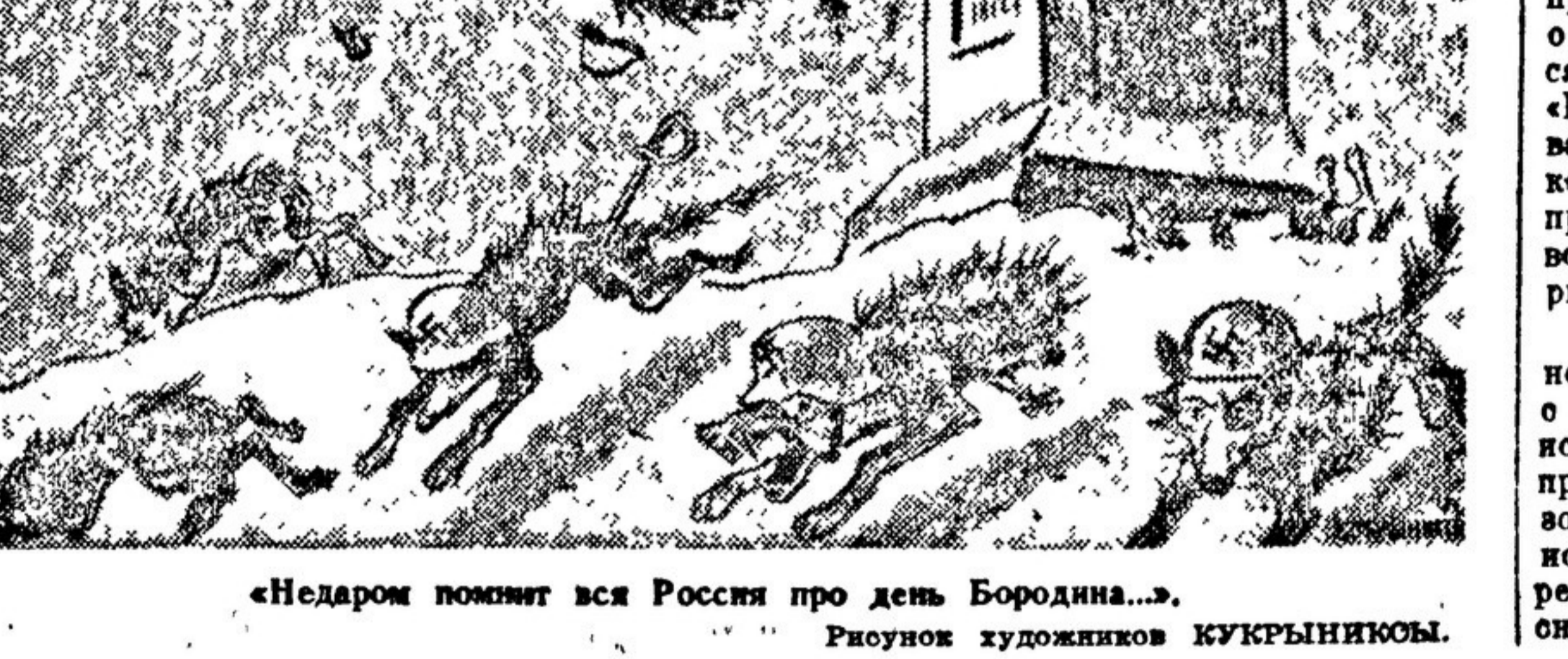
«Недаром помнит вся Россия про день Бородина...» Рисунок художников КУКРЫНИКОВ.

Восоевине гастролирующий концертное объединение, помимо 60 фронтовых бригад, направленных для обслуживания бойцов и командиров в части Красной Армии, проведет за эти дни свыше 160 концертов в воинских частях столиц, в дворцах культуры, клубах Москвы и области и др.