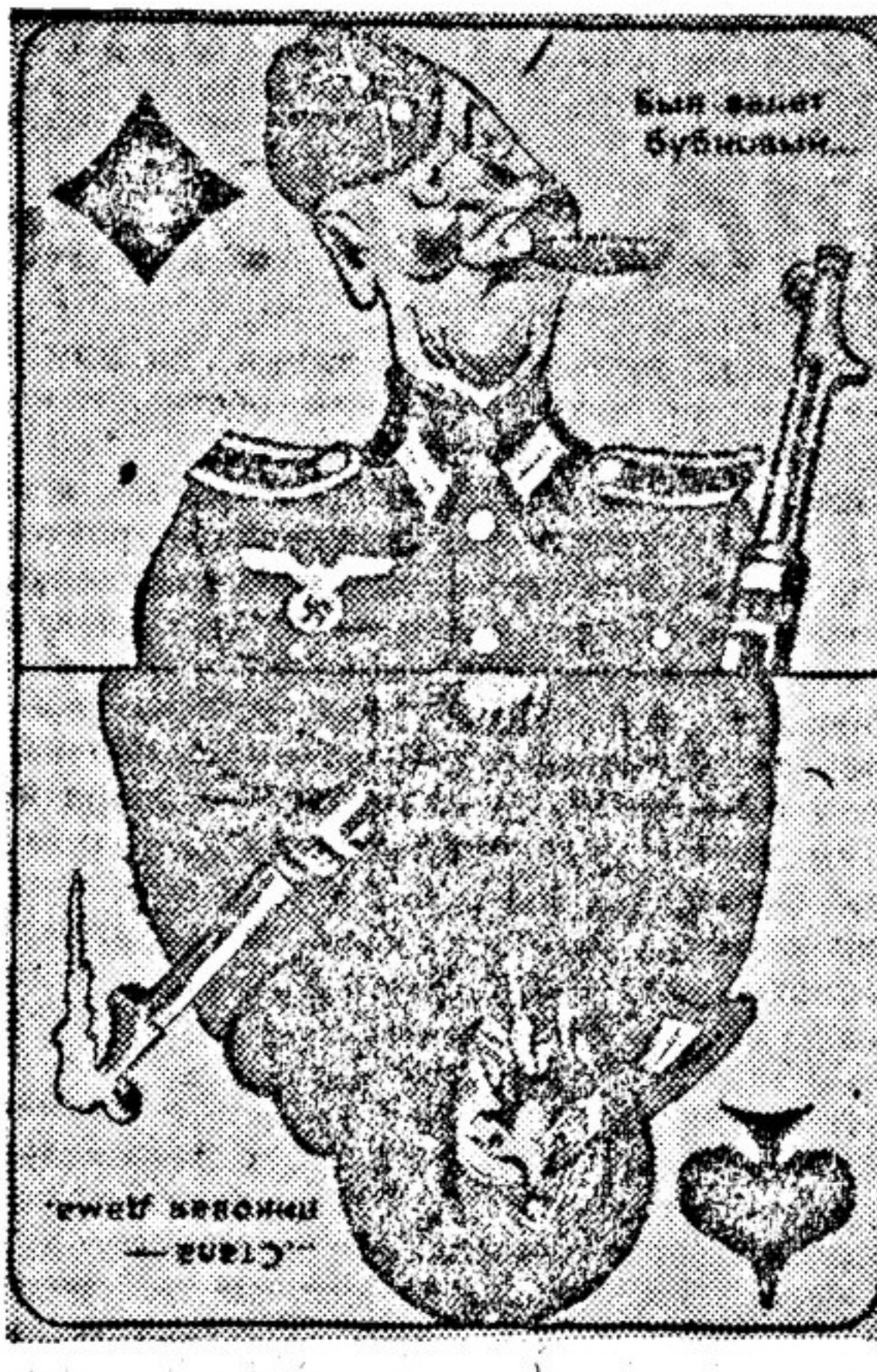
Битая карта. Открыты, выгнуты, выгнуты Военкоматом Народного Коммунистического Оборона СССР. Рис. художника Бор. Ефимова.